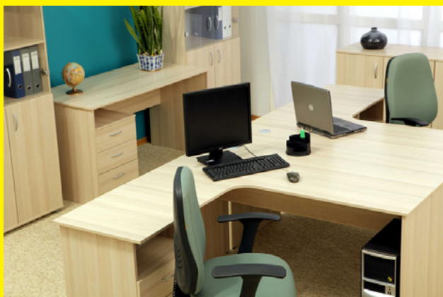
Цена комплекта стол + стул 4800 рублей

Видно, что за сравнимые деньги у воронежского производителя можно получить товар лучшего качества и более удобный для посетителей. Региональные фабрики, как правило, находятся не в том положении, чтобы отказывать заказчикам. Поэтому кроме закупки готовой мебели, с их технологами можно разрабатывать собственные линейки. К примеру, многие соглашаются на то, чтобы выкрасить мебель под заказ или даже собирать специальные объекты из готовых модулей. Это позволяет учреждениям культуры подстраивать готовую мебель под свои требования.