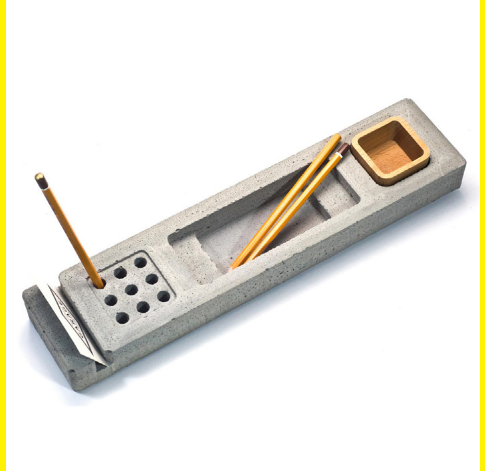
Работы студии Garage из Казани. Эти аксессуары выполнены из бетона