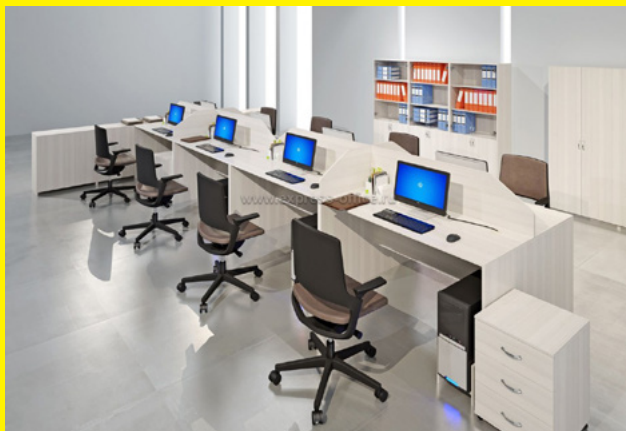
Цена стола: 1982 рубля

Для наглядности ниже приводится сравнение двух неназываемых фабрик — одна из Москвы, другая из Воронежа.