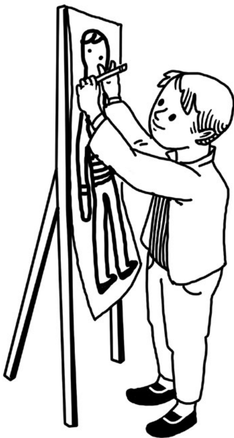
Школьники-мигранты рисуют и рассказывают о себе

с кем. В результате важные для ребенка вещи остаются не вполне осмысленными. Истории мигрантов редко фигурируют в СМИ, и местное население не представляет, какой жизнью они живут и с какими проблемами им пришлось столкнуться. Возможность рассказать о миграционном и интеграционном опыте, которую организаторы практики предоставили детям-мигрантам, была важна как для детей, принявшим в ней участие, так и для горожан, которым был адресован этот рассказ.