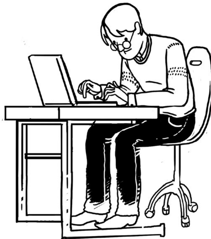
Мигранты пишут статьи в местные газеты в Финляндии

Волонтеры, выбранные из числа студентов-переводчиков, назначались координаторами проекта. Их задача состояла в том, чтобы находить авторов среди мигран-