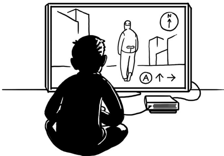
Школьник играет в компьютерную игру про мигрантов

герой сталкивается со всеми сложностями, которые приходится преодолевать реальным мигрантам. Для того чтобы приблизить игровой сюжет к реальности, разработчики сначала изучили данные о миграционных потоках в Венгрию, а затем свели воедино жизненные истории нескольких десятков мигрантов, частично воплотив их в персонажах игры. Игра сразу же была переведена на английский язык, и на сайт с самого начала заходили посетители из разных стран. Однако, поскольку информация об игре распространялась в венгерских школах, основными потребителями игры стали именно венгерские подростки.