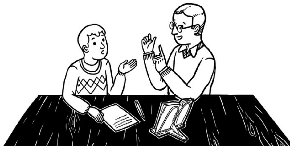
Студенты-лингвисты помогают детям из семей беженцев учиться

50 студентов языковых вузов с фарси, арабским, пушту или курдским в качестве профильного языка прошли конкурс на позицию волонтера и специальное обучение, а затем ежедневно встречались с детьми беженцев, занимались с ними болгарским языком, помогали гото-