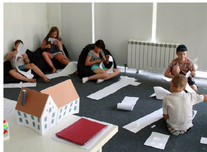
рис. 7 На смене «Урбанистика» в летнем лагере КЦ ЗИЛ дети придумывают, как сделать город лучше

В Московском городском психолого-педагогическом университете (МГППУ) действует Центр игры и игрушек. В основном специалисты центра оценивают безопасность, прочность, привлекательность игрушек. Помимо этого со-