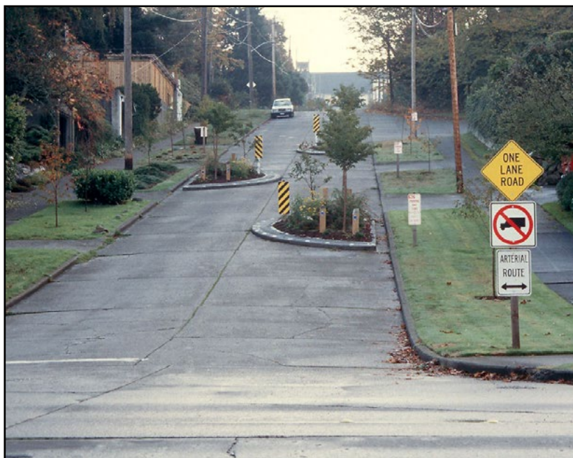
рис. 1 Чтобы дороги в жилых зонах были безопаснее, используют метод успокоения движения

Важный элемент дружелюбного города — возможность детям передвигаться по району самим, без взрослых. Главное препятствие для независимой мобильности — автомобили.