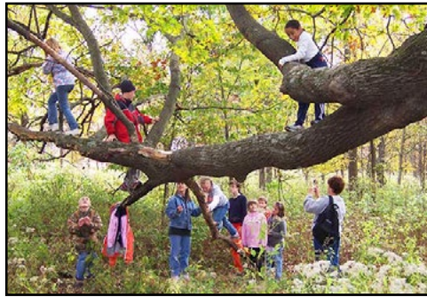
рис. 5 Деревья - лучшая игровая площадка, на которой дети учатся оценивать риски

Едва ли не главная причина, по которой родители отказывают детям в свободе игры и перемещения — это страх за их безопасность. Зачастую он преувеличен.