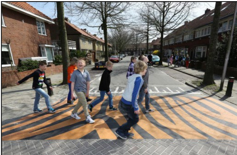
рис. 2 Дорожная расцветка на детском маршруте может в игровой форме учить правилам дорожного движения — как в голландском Леувардене

Город, дружелюбный детям, на практике означает город, дружелюбный семьям. В нем учитывается, что занятия членов семьи должны сочетаться в пространстве района.