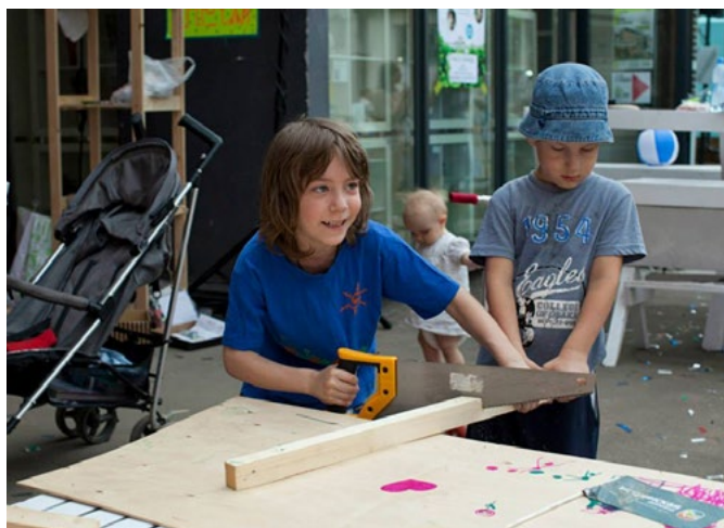
рис. 6 «Город-друг» устраивает на фестивалях «Стройку века», где дети и родители вместе мастерят площадки для игры