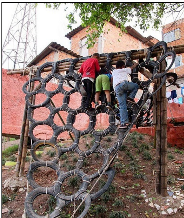
рис. 3 Нестандартные площадки для свободной игры не обязательно затратны в изготовлении

Концепцию дружелюбного города трудно представить без свободной игры, free play. Ключевым элементом свободной игры — это спонтанность.