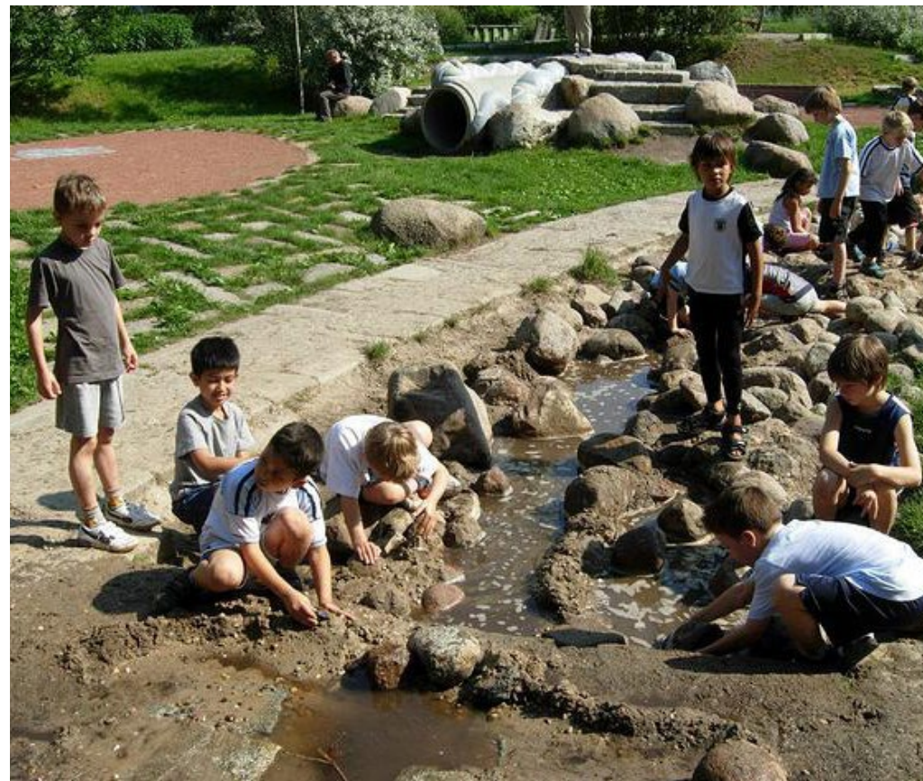
рис. 10 Природные площадки с водой и песком представляют отличные игровые возможности в том числе для детей с ментальными особенностями

анализировать пространство с точки зрения детей с особыми потребностями, разрабатывать интегративные программы (например, предусматривать возможности тактильного изучения окружающей обстановки незрячими и слабовидящими детьми). Для детей с ментальными особенностями важно создавать многофункциональные детские площадки;