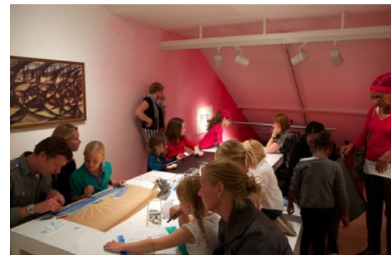
рис. 8 В семейных студиях — например, в Family Lab при музее Стеделик — дети могут включиться в жизнь учреждения культуры

создавать специальные детские пространства и студии, связанные с общей концепцией работы (например, в музеях и выставочных залах можно организовать серии занятий по мотивам экспозиции);